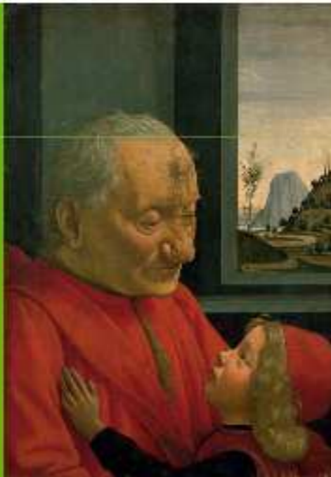
Musée du Louvre. Le vieillard et l'enfant , D. Ghirlandaio