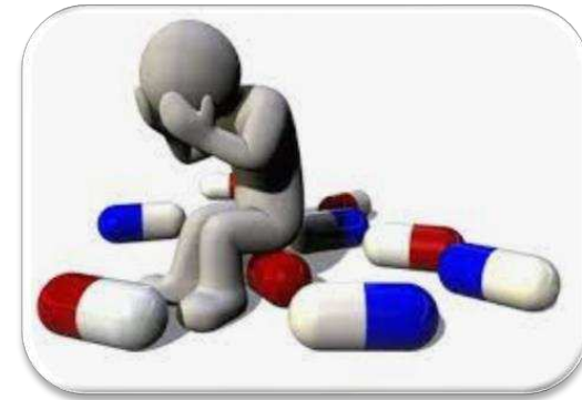
Effets indésirables des médicaments