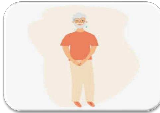
Incontinence urinaire de novo